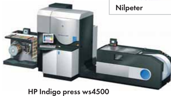
HP Indigo press ws4500